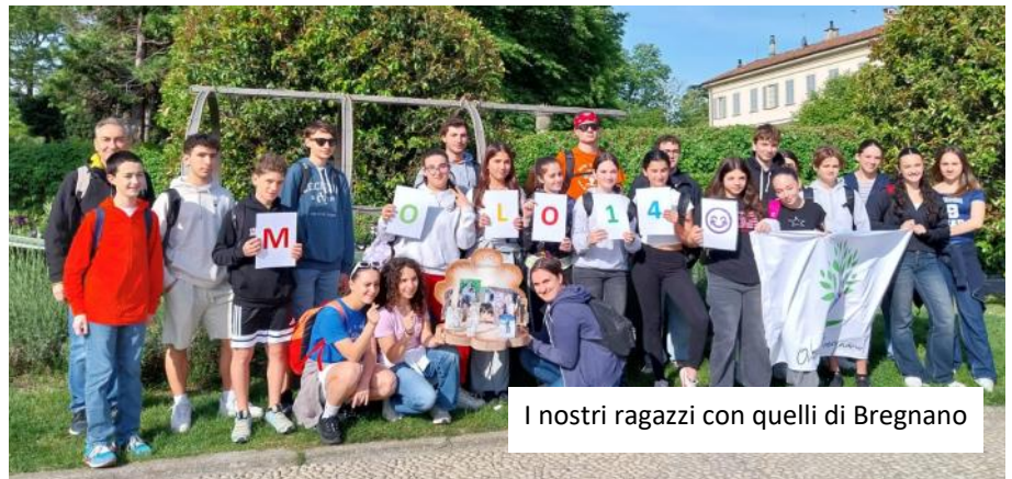
I nostri ragazzi con quelli di Bregnano

Dopo la Messa in oratorio per i festeggianti ci sarà un semplice aperitivo offerto dai fidanzati che si stanno preparando al Matrimonio cristiano: sarà un po' come un "passaggio di testimone"... AUGURI!!